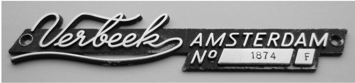
Dit merkteken was van een lintmes snijmachine van het type F

In aanvang moesten de monteurs alle werkzaamheden verrichten die nodig waren om een complete machine met tafel en motor verkoopklaar te maken. Omdat men echter de verkoop niet kon bijhouden, werd al gauw besloten dat er afzonderlijke afdelingen moesten komen. Zo kwam er een montageafdeling voor de tafelbouw, een elektrotechnische dienst voor alle elektrische werkzaamheden