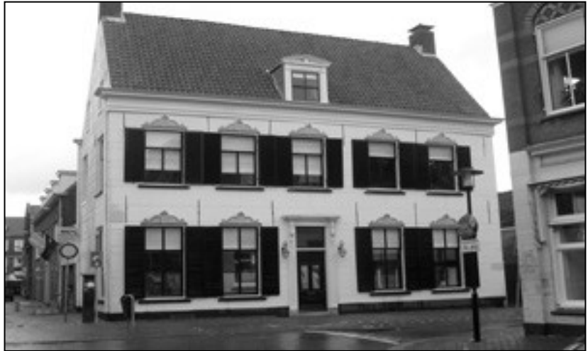
Gasthuisstraat 96 Tiel

In het jaar 2000 ging ook de vestiging in Geldermalsen dicht en gaat men kantoor houden in Tiel (hoe klein kan de wereld zijn, want daar woon ik immers zelf!) in een fraai pand aan de Gasthuisstraat 96. Het bedrijf voert nu de naam Machiver BV, een dochter van de Holding Maatschappij Verbeek. ( Machi van machinefabriek en ver van Verbeek)