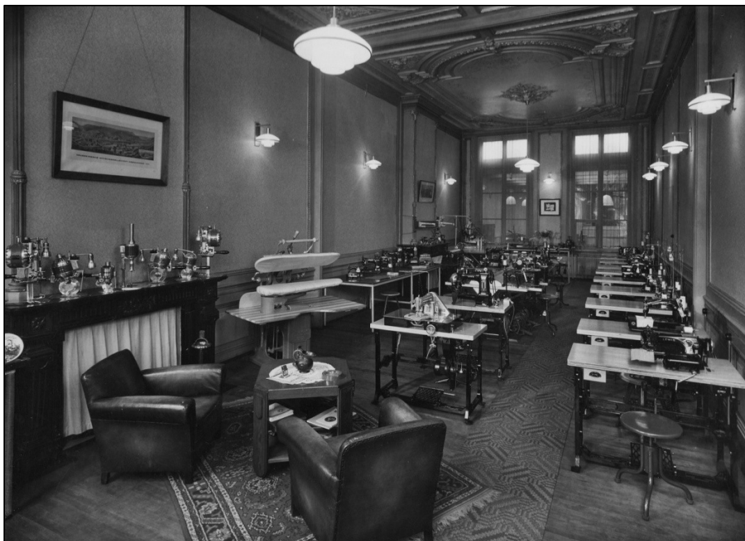
1940 de monsterkamer