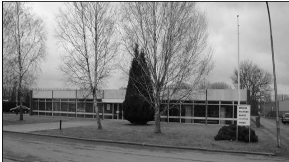
Mechelen in België

Later werden van de Nederlandse werknemers langzamerhand de opgebouwde privileges ingekrompen of afgeschaft onder het mom, dat men nu in België zat met hun eigen wetten. Ondanks dat het personeel wees op bestaande afspraken hield de directie voet bij stuk. Volgens velen konden de Verbeken daarna geen goed meer doen. Het