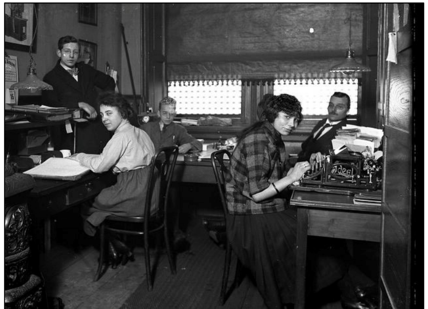
De administratie van voor de oorlog. Men maakte toen al gebruik van een dictafoon; door de correspondent op een wasrol ingesproken brief, die middels een koptelefoon door de typiste kon worden afgeluisterd.

De firma Verbeek had voor de Benelux de import en vertegenwoordiging van alle Pfaff industrienaaimachines, uitgezonderd de schoenen- industriemachines en de huishoudnaaimachines. Deze werden uitgevoerd en verkocht door een in deze branche reeds lang bestaande firma, die bekend stond als de firma Pfaff Benelux te 's-Hertogenbosch. Deze firma kwam in de zeventiger jaren in ernstige betaalmoeilijkheden en wel zo erg, dat de Pfaff fabrieken in Duitsland de firma Verbeek benaderden met het verzoek, of men dit bedrijf met al zijn schulden en personeel wilde overnemen. Men kreeg daarmee het recht voor de verkoop van naaimachines voor de schoenenindustrie en de huishoud naaimachines en daarbij alle Pfaff winkels en vestigingen over de hele Benelux. De directie besloot op het voorstel in te gaan en kwam een betalingsregeling overeen, waardoor Pfaff Nederland geheel in handen kwam van de Holding Maatschappij Verbeek. Deze overname had wel tot consequentie dat de vestiging in 's-Hertogenbosch geheel werd gesloten.