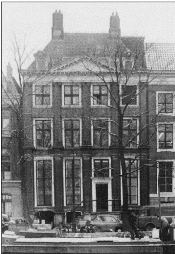
Kloveniersburgwal 77 en rechts 79. Het bedrijfsbusje rechts is van C & H Verbeek

In aanvang moesten de monteurs alle werkzaamheden verrichten die nodig waren om een complete machine met tafel en motor verkoopklaar te maken. Omdat men echter de verkoop niet kon bijhouden, werd al gauw besloten dat er afzonderlijke afdelingen moesten komen. Zo kwam er een montageafdeling voor de tafelbouw, een elektrotechnische dienst voor alle elektrische werkzaamheden